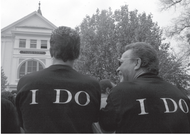
ภาพประกอบ 1 รักร่วมเพศ การแต่งงานของคนเพศเดียวกัน และการนอกใจ คู่สมรส ล้วนขัดกับหลักการของกฎหมายธรรมชาติ

สังขธรรมทางจริยธรรมอยู่จริง โดยหากเราคิดไตร่ตรองเหตุผลแล้ว ก็ย่อมค้นพบสังขธรรมดังกล่าว