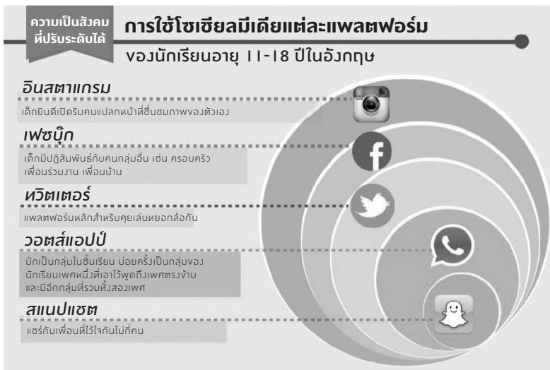
ภาพ 1.3 ระดับของโซเชียลมีเดียที่เด็กนักเรียนในอังกฤษใช้

ใช้มันเพื่อสร้างและรักษาความไว้วางใจในคนกลุ่มเล็กๆ ได้ การสื่อสารที่มีขนาดใหญ่ขึ้นคือกลุ่มที่สร้างในวอตส์แอปป์ ปกติแล้วในชั้นเรียน เด็กจะสร้างกลุ่มในวอตส์แอปป์ที่มีเด็กผู้ชายทุกคนในห้องเพื่อเอาไว้อัดเสียงเด็กผู้หญิง (หรือกลุ่มเด็กผู้หญิงพูดถึงเด็กผู้ชายก็มี) และอาจมีอีกกลุ่มที่รวมทุกคนในชั้นเรียนด้วย ช่องทางที่เข้าถึงคนกลุ่มใหญ่ขึ้นคือทวิต ซึ่งจะเข้าถึงทุกคนที่กดติดตามคนคนนั้นในทวิตเตอร์ นี่คือพื้นที่หลักที่เพื่อนฝูงใช้หยอกล้อกัน บางครั้งก็มีนักเรียนชั้นปีเดียวกันจากห้องอื่นมาผสมโรงด้วย ส่วนเฟซบุ๊กคือที่ที่รวมคนอื่นนอกชั้นเรียนไว้ โดยนักเรียนกลุ่มนี้จะใช้เฟซบุ๊กเพื่อเชื่อมต่อกับครอบครัว เพื่อนบ้าน และคนอื่นที่อยู่นอกโรงเรียน สุดท้ายคืออินสตาแกรม ซึ่งวงสังคมของนักเรียนแต่ละคนมักประกอบไปด้วยเด็กนักเรียนในโรงเรียนเดียวกัน ขณะเดียวกันมันก็เป็นแพลตฟอร์มเดียวที่พวกเขายินดีเปิดรับคนแปลกหน้า เพราะการได้ติดต่อกับคนเหล่านี้แสดงให้เห็นว่า มีใครบางคนที่เด็กไม่รู้จักเข้ามาชื่นชมความงามของรูปภาพที่เด็กกลุ่มนี้โพสต์ในอินสตาแกรมด้วย (ภาพ 1.3)