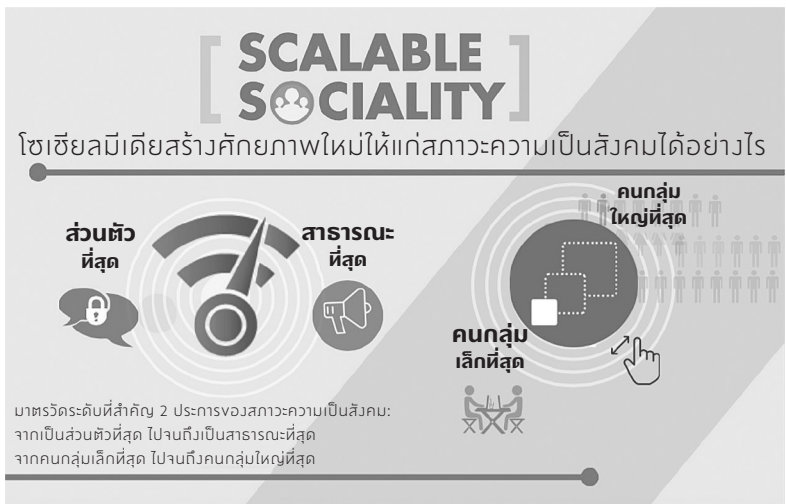
ภาพ 1.1 สภาวะความเป็นสังคมที่ปรับระดับได้

แน่นอนว่าการนิยามโซเชียลมีเดียโดยใช้แค่สิ่งที่มีอยู่ในตอนนี้มี ข้อจำกัด เพื่อให้นิยามและแนวทางของเราใช้ได้ในระยะยาว เราต้องคิดถึง แพลตฟอร์มโซเชียลมีเดียใหม่ๆ ที่กำลังอยู่ระหว่างการพัฒนาไว้เสมอ รวมถึงโอกาสที่บางแพลตฟอร์มจะประสบความสำเร็จยิ่งยวดในอนาคต ด้วย หากเรามองออกว่ามีแพลตฟอร์มโซเชียลมีเดียเกิดขึ้นใหม่ในรูปแบบ ใดย่อมมีประโยชน์อย่างยิ่ง บางแพลตฟอร์มลดระดับลงจากการกระจาย เสียงสาธารณะ ขณะที่บางแพลตฟอร์มเพิ่มระดับขึ้นจากการสื่อสารส่วนตัว เมื่อมีแพลตฟอร์มใหม่ๆ มากขึ้นในอนาคต ผลลัพธ์ที่เราน่าจะได้เห็นอาจ เป็นระดับการสื่อสารที่อยู่ระหว่างความเป็นสาธารณะกับความเป็นส่วนตัว ซึ่งเราพอจะระบุได้ว่าแต่ละแพลตฟอร์มอยู่ในระดับใด